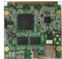
i.MX51 SOM 70mm x 70 mm