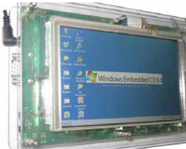
iW-RainboW-G8D本体 (7インチタッチパネルLCD標準装備)